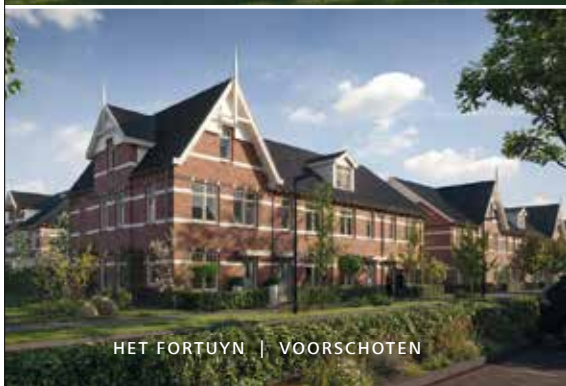
HET FORTUYN | VOORSCHOTEN