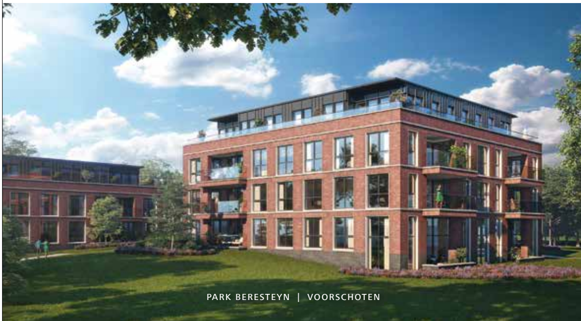
PARK BERESTEYN | VOORSCHOTEN