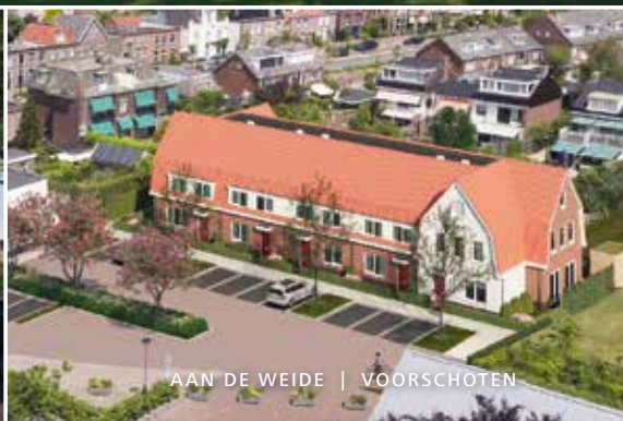
AAN DE WEIDE | VOORSCHOTEN

WIJ WERKEN ER HARD AAN OM MET DEZE EN ANDERE PROJECTEN VOORSCHOTEN NOG MOOIER TE MAKEN